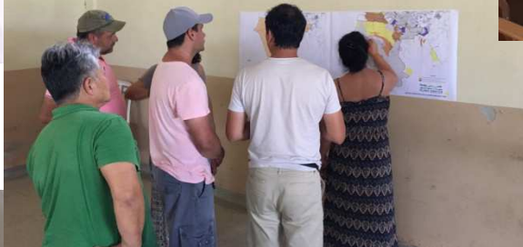
Chácara dos Baianos