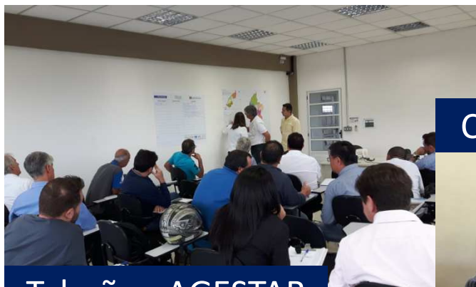
Taboão - AGESTAB